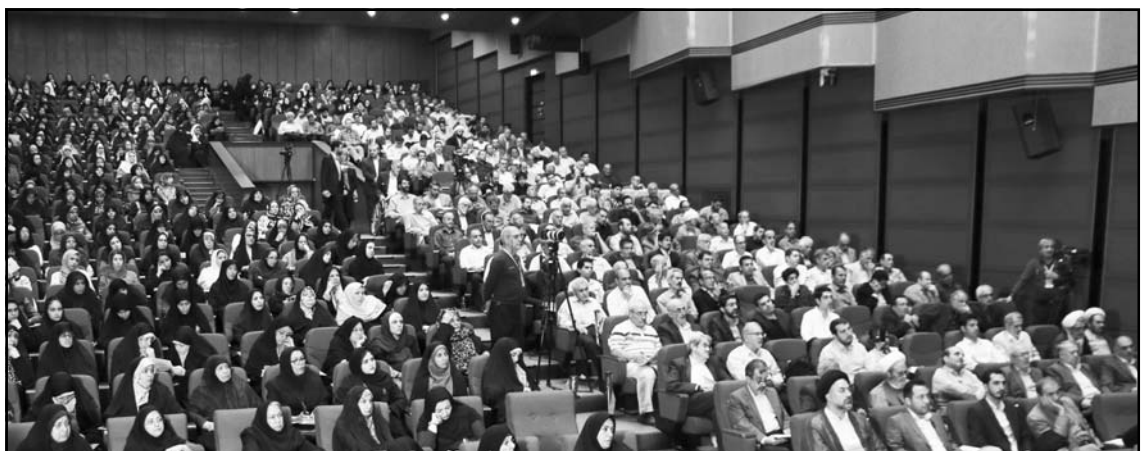
این عکس مربوط به آرشیو همایش سال ۱۳۹۸ است.

همان صراط مستقیم است. قرآن مجید از این انحراف بشر به «فسق» و «کفر» (کفران نعمت) و «فساد» (یعنی برهم زدن دستگاه طبیعت) تعبیر میکند، که ثمره آن، بحکم قوانین قاطع و سنن الهی ثابت و قواعد تاریخ و فلسفه آن، انواع شرور و خطرها و آسیبها و ضررها میباشد؛ مانند بلاهای طبیعی، خشکسالی، ظهور حشرات و موجودات مضر و بویژه بیماریهای مسری و کشنده مانند وبا و طاعون و ویروسهای دیگر، که در تاریخ آمده و امروز نیز در جهان دیده میشود. کیفی اعمال و گناه بشر گرچه بصورت عواملی طبیعی و بیماری ظاهر میشود ولی همه اینها دستاورد خود بشر و نتیجه کردار غلط و نادرست او میباشد، یعنی اساساً شر در خلق جهان نیست مگر آنکه جهان از دست آزار بشر و نافرمانی او نتنگ آمده و او را به کیفی مبتلا سازد. این رفتار جهان، رفتاری ناخواسته است و گویی روح بزرگ حاکم بر جهان بر اساس و بحکم قانون عدل (یعنی لزوم حفظ اعتدال و نظم جهان و دوام آن بر منهای حکمت و حکم الهی)، خود را موظف مبیند که برهمزنان نظم نظام آفرینش و جهان طبیعت را گوشمالی دهد و آنها را به رعایت این نظم سراسر خیر وادار سازد. «انذار» و «تبشیر»، دو وظیفه انبیاء، همه برای این بود که بشر را به خیر و سعادت رهنمون شوند و او